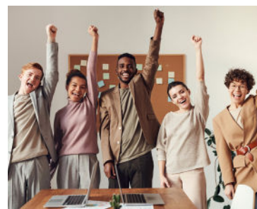
Appel d'offres CSE